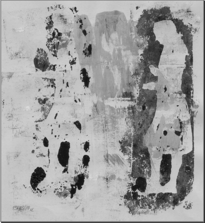
»GOETHES GEIST« (Kolorierter) Linol-Druck Nadine Chmura, Marburg